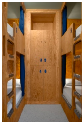
Une chambre dortoir pour six personnes.