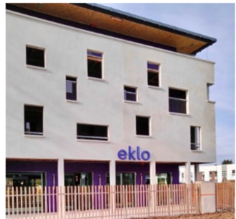
L'hôtel Eklo de Marne-la-Vallée est le 6e de l'enseigne.