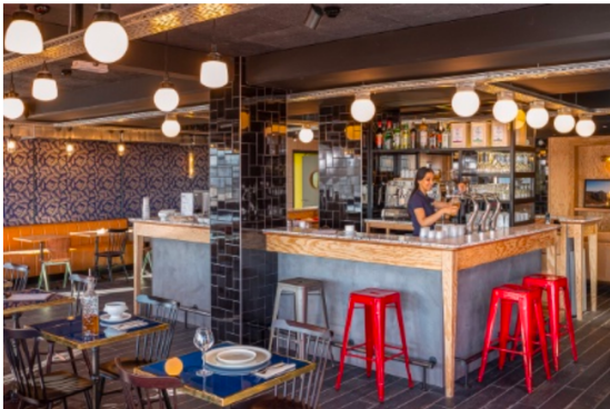
Eklo mise sur des espaces communs conviviaux.