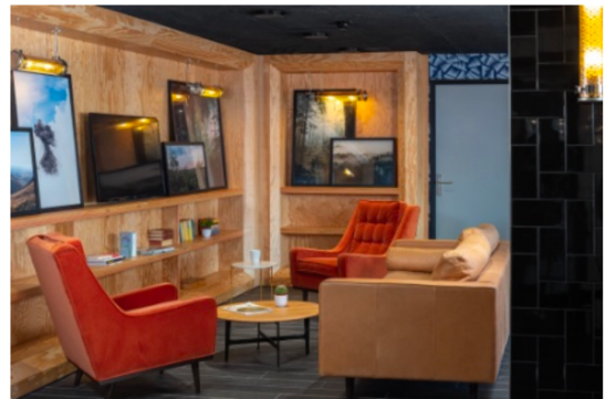
Eklo mise sur des espaces communs conviviaux.